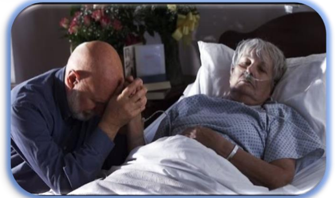
Natural & Accidental Death