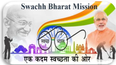
CLEAN INDIA GREEN INDIA